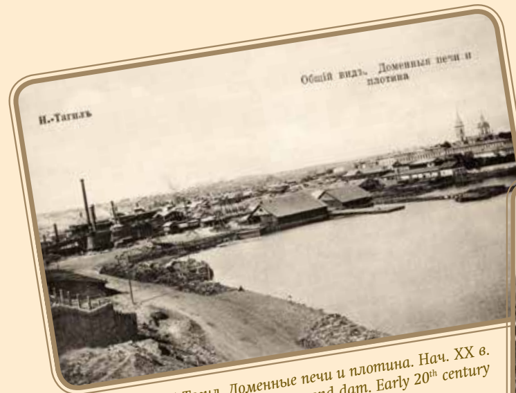
Нижний Тагил. Доменные печи и плотина. Нач. XX в. Nizhny Tagil. Blast furnaces and dam. Early 20 th century