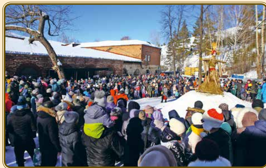
Празднование Масленицы в Арт-резиденции Celebration of Maslenitsa in the Art residence