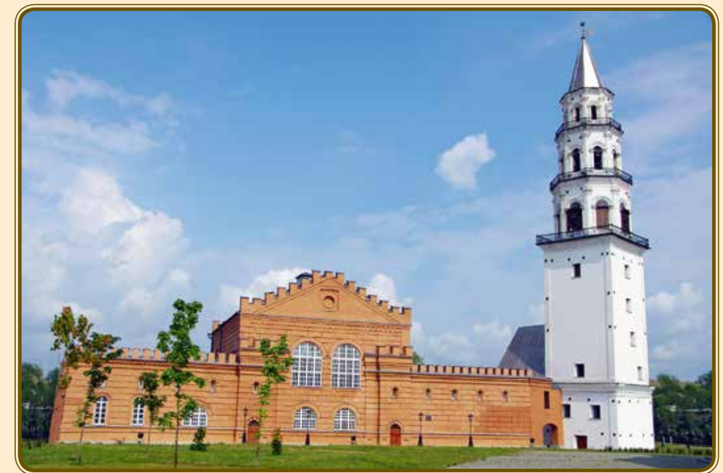
Невьянск. XXI в. Nevyansk. 21 st century.