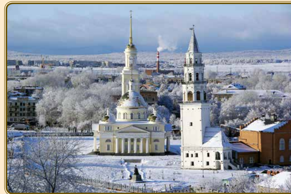
Невьянск. Собор и наклонная башня. XXI в. Nevyansk. The cathedral and the leaning tower. 21 st century.