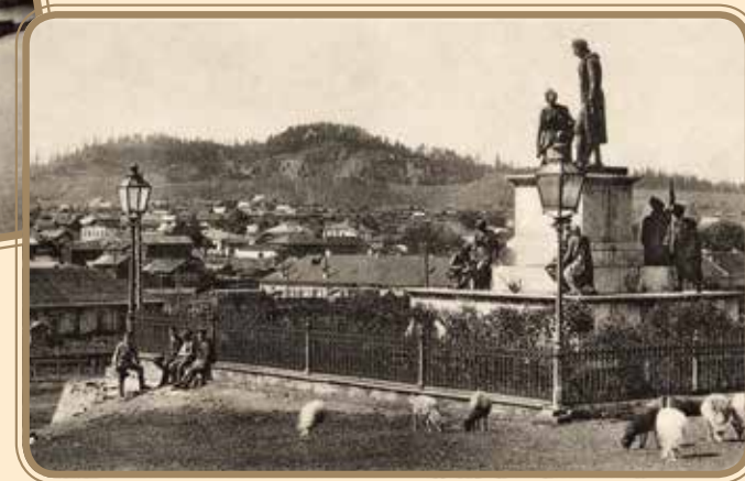
Нижний Тагил. Гора Высокая. Памятник Н.Н. Демидову. Нач. XX в. Nizhny Tagil. Mount Visokaya. Monument to N.N. Demidov. Early 20 th century