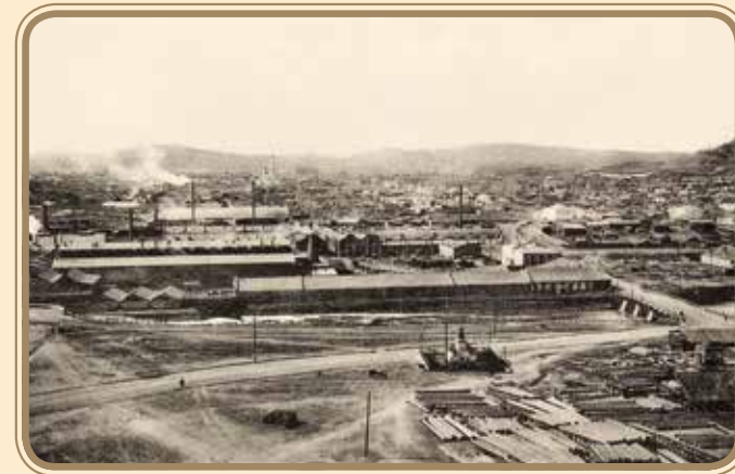
Нижний Тагил. Общій вид завода. Нач. XX в. Nizhny Tagil. Overview of the plant. Early 20 th century