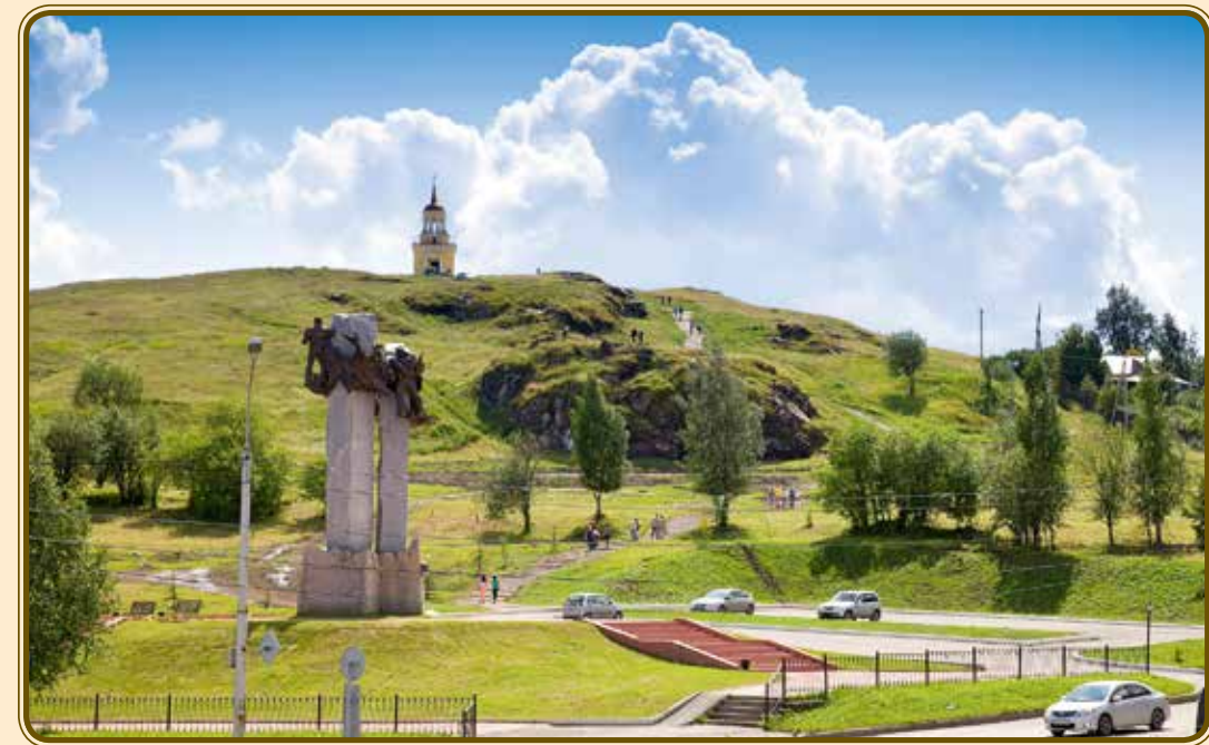
Нижний Тагил. Лисья гора, башня и памятник металлургам Нижнего Тагила. XXI в. Nizhny Tagil. Lisya Mountain (Fox Mountain), a tower and a monument to the metallurgists of Nizhny Tagil. 21 st century.