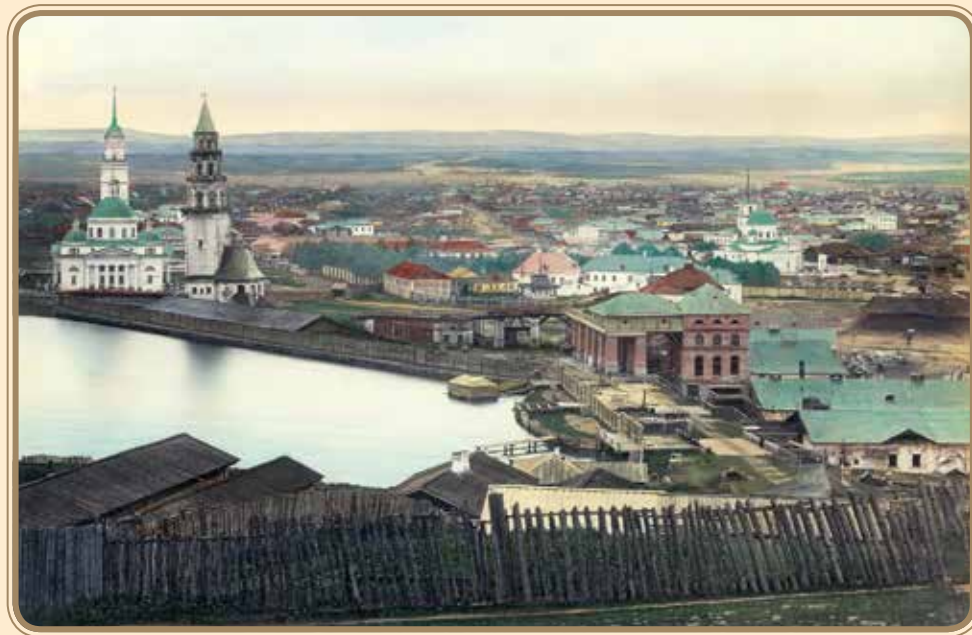
Невьянск. Общий вид. Нач. XX в. Nevyansk. Overview. Early 20 th century