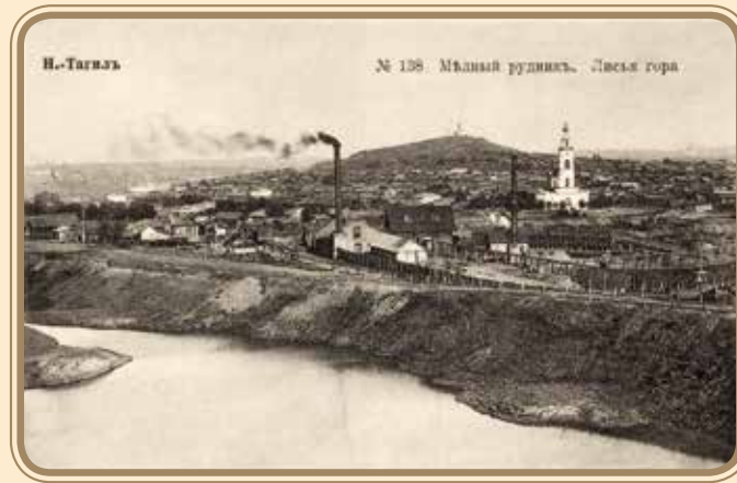
Нижний Тагил. Медный рудник. Лисья гора. Нач. XX в. Nizhny Tagil. Copper Mine. Lisya Mountain (Fox Mountain). Early 20 th century