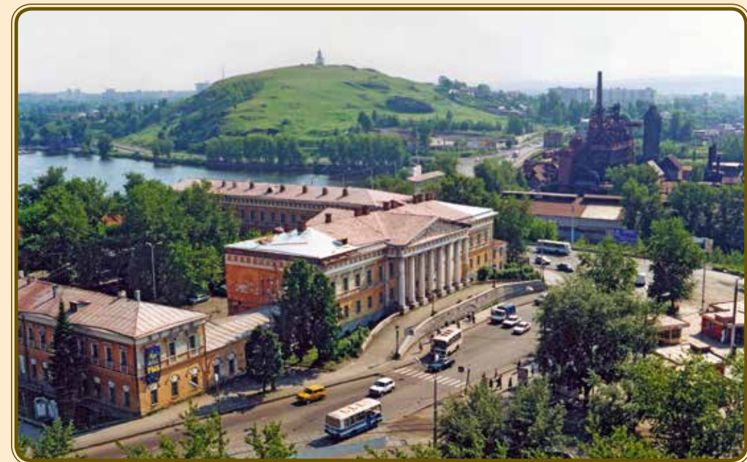
Нижний Тагил. Панорама. Нижнетагильский музей-заповедник, музей-завод и Лисья гора. 2002 г. Nizhny Tagil. Panorama. Nizhny Tagil Museum-Reserve, plant Museum and Lisya Mountain (Fox Mountain). 2002.