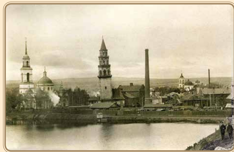
Невьянск. Завод, собор и наклонная башня. Ок. 1905–1915 Nevyansk. Cathedral, plant and the leaning tower. Approx. 1905–1915